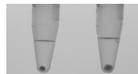
Abb.1: empfohlene Pelletgrößen Links: max. bakterielle Pelletgröße Rechts: max. Pelletgröße für Probe, die Partikel enthält