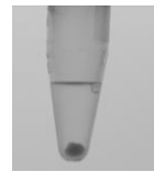
Abb.1: maximal empfohlene Pelletgröße