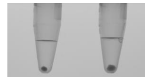
Abb. 1: empfohlene Pelletgrößen Links: max. bakterielle Pelletgröße Rechts: max. Pelletgröße für Probe, die Hefe enthält