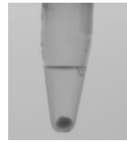
Abb.1: empfohlene Pelletgröße für Probe, die Partikel enthält